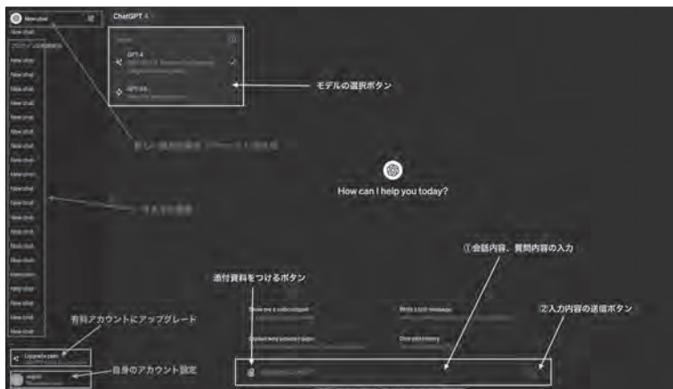
図1 ChatGPTのサービス画面

その高度な言語処理能力により、教育、ビジネス、研究など、さまざまな分野で活用されていて、AI技術の新たな可能性を示しています（図1）。