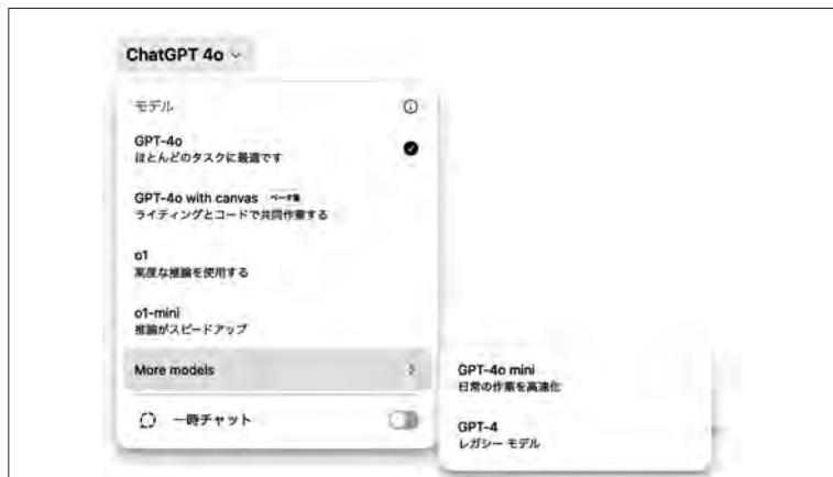
図2 モデルの選択画面

2024年12月時点では「OpenAI o1 ※ 」が利用できるようになり、Proプランでは「o1-pro」が利用できるようになっています。