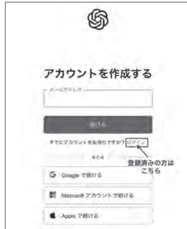
図4 ChatGPT登録・ログイン画面